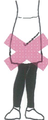
スカートにスパッツ・レギンス類