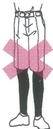
半ズボンにスパッツ・レギンス類