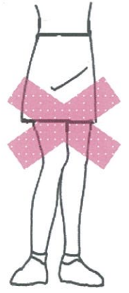
ミニスカート キュロット

※ジーンズ・カーゴパンツ(男子はアウトポケット・インポケット並びにチャックも不可)・スウェット・ジャージ