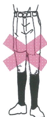
丈の短い半ズボン